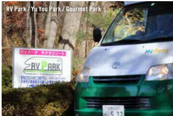
RV Park / Yu You Park / Gourmet Park

『RVパーク』は、24時間利用可能なトイレ、電源を完備した、キャンピングカーで宿泊可能な有料駐車場です。『湯 YOUパーク』は、提携の温泉施設の駐車場で宿泊でき、温泉を利用することができます。『グルメパーク』は、提携の飲食店で食事をすれば、施設内の駐車場で宿泊できます。