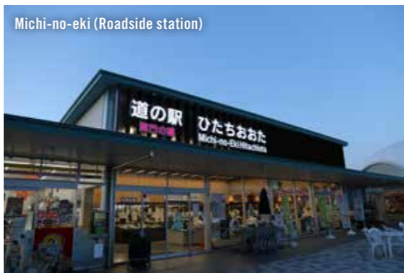
Michi-no-eki (Roadside station)

日本全国に1,000ヶ所以上ある、24時間利用可能な広い面積をもつ無料パーキングと清潔なトイレを完備した休憩施設です。昼間は、地元の特産物やお土産が購入でき、旅に役立つ情報を得ることができます。温泉を併設した施設もあります。仮眠は可能ですが、連泊はできません。キャンピングカーからテーブルや椅子を降ろして使用することはできません。駐車場内でのBBQなど火気の使用はできません。(車内の設備を使っての調理は可能です) マナーを守って使用して下さい。