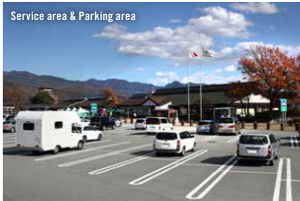
Service area & Parking area

高速道路にあるサービスエリア、パーキングエリアは、24時間利用可能な、飲料の自動販売機や清潔なトイレを完備した休憩施設です。サービスエリアにはガソリンスタンドやレストランも完備しています。仮眠は可能ですが、宿泊はできません。キャンピングカーからテーブルや椅子を降ろして使用することはできません。駐車場内でのBBQなど火気の使用はできません。(車内の設備を使っての調理は可能です) マナーを守って使用して下さい。