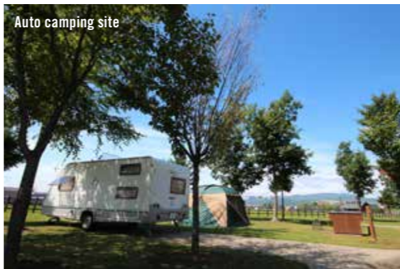
Auto camping site

オートキャンプ場は日本全国に1,000ヶ所以上あります。電源設備がない施設もあります。また、キャンピングカーが入れない施設もありますので、ご注意ください。